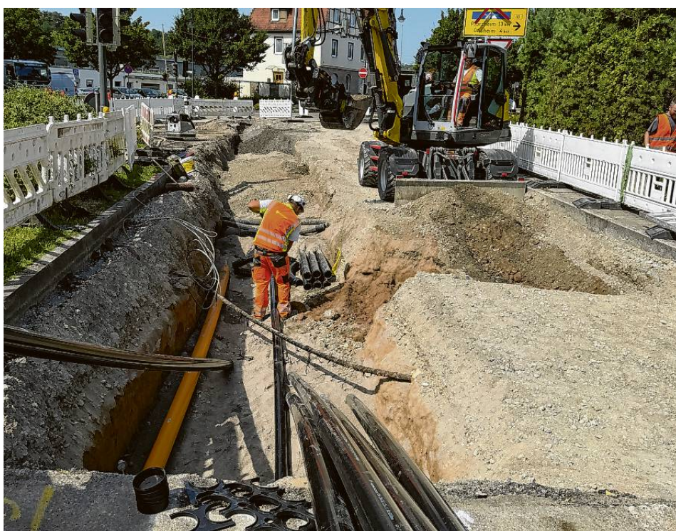
Stadtwerke nutzen die B10-Baustelle für Leitungsarbeiten.

„Unser gemeinsames Ziel ist der Versorgungssicherheit“, betont Jans, der auch jeglichen Sanierungsstau vermeiden möchte. Die acht Millionen Euro, die die Stadtwerke in diesem Jahr verbuddeln und verbauen, seien eine Rekordsumme.