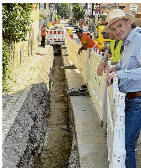
Glasfaserausbau in Mühlhausen.

Die Biogasanlage spielt aber auch eine entscheidende Rolle für das benachbarte