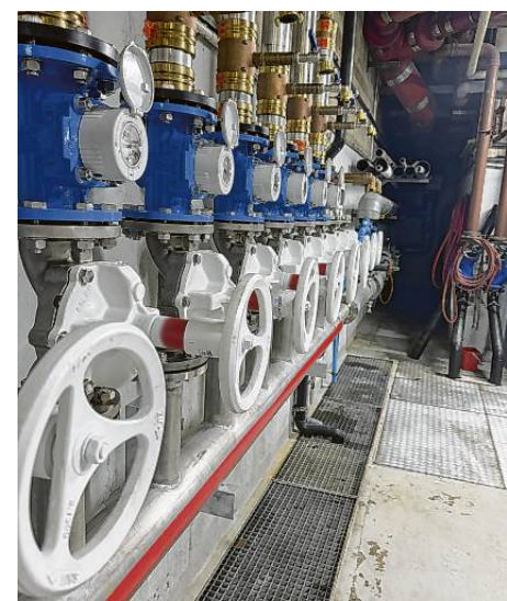
Trinkwasserverteiler im Hallenbad.

Die Stadtwerke können aber nicht nur Mist und Gülle, sondern sind in Mühlacker auch für das Lebensmittel Nummer eins und die wohl kritischste Infrastruktur verantwortlich: das Trinkwasser. Ausfälle in der Wasserversorgung würden existenzielle Probleme nach sich ziehen. Deshalb betreiben die Stadtwerke nicht nur ein Netz von Brunnen und Hochbehältern, um die Stadt zu versorgen, sondern haben für Ausfälle nicht nur einen Plan B, sondern auch die Pläne C und D in der Tasche. So würde für den Hochbehälter im Lindachgebiet eigentlich eine Pumpe reichen, stattdessen montieren die Stadtwerke dort aktuell vier neue Pumpen, Steuerungsanlagen und ein Notstromsystem, um für alle Fälle gerüstet zu sein. „900.000 Euro kostet die neue Anlagentechnik“, berichtet Frederik Trockel, Abteilungsleiter Gas, Wasser, Wärme bei den Stadtwerken.