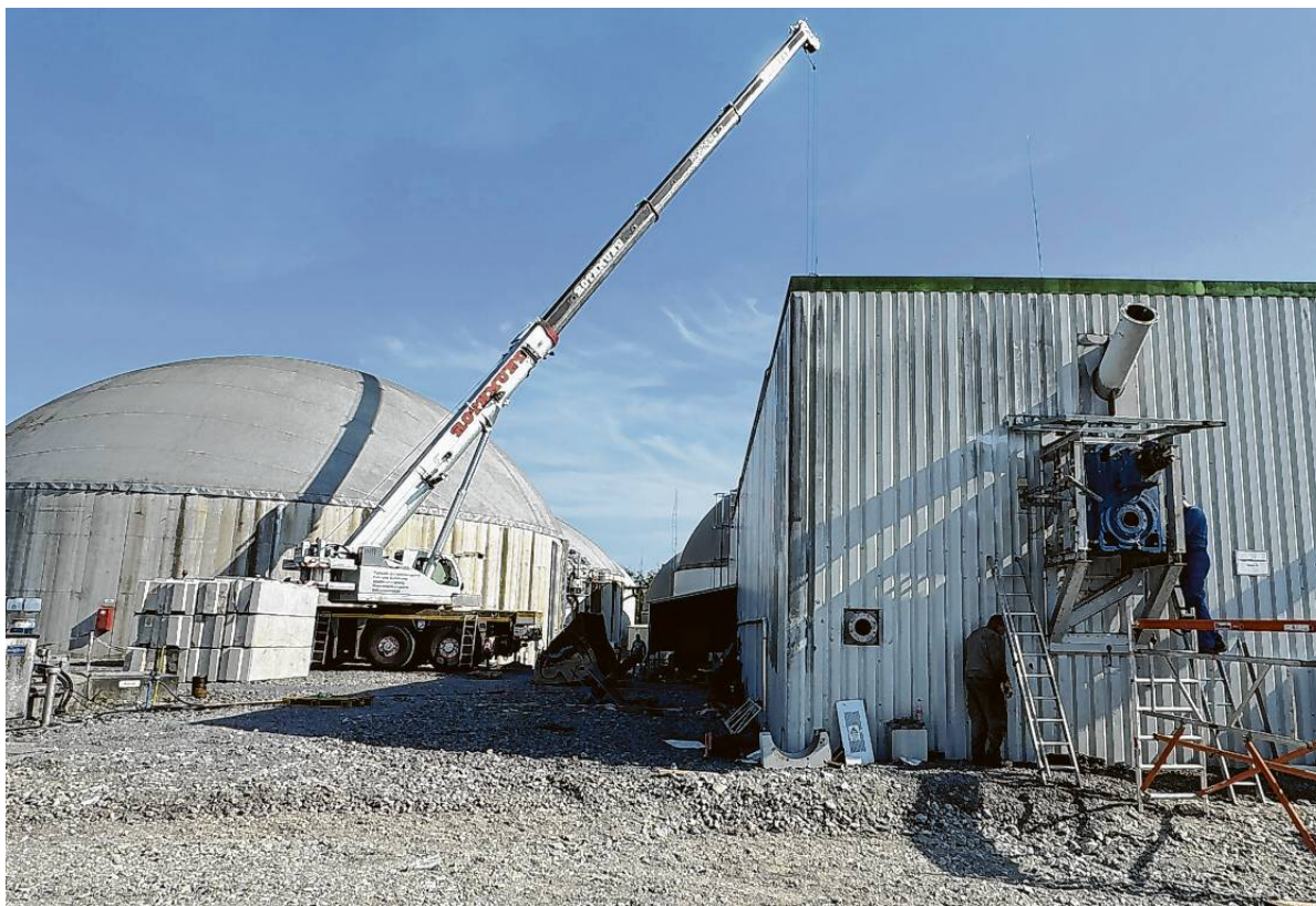
Mehr Pferde- und Rindermist und weg vom Mais: Biogasanlage spielt eine wichtige Rolle für die Zukunftsplanung. Neben den Annahmedosierern wird auch der Gärbehälter saniert.