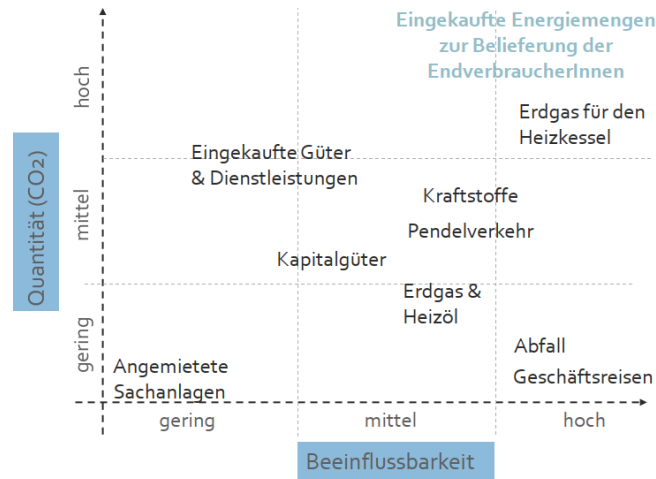
Abbildung 3: Wesentlichkeitsbewertung der Emissionsquellen der Stadtwerke Mühlacker

Das Kernelement ist die drastische Verringerung des Ausstoßes von Treibhausgasen. Hier haben die SWM als lokales Energiedienstleistungsunternehmen bedeutenden Einfluss. Daher wurde das übergeordnete Ziel in einzelne Handlungsfelder unterteilt. Diese betreffen jeweils die Emissionen der drei Sparten Strom, Erdgas und Trinkwasser sowie alle internen Emissionen, Dienstleister, Lieferanten und Marktpartner. Zur Erreichung unseres Klimaziels haben wir drei Meilensteine gesetzt: